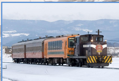
津軽鉄道 ストーブ列車 (五所川原駅～金木駅まで乗車)