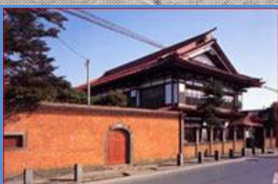
太宰治の生家 斜陽館